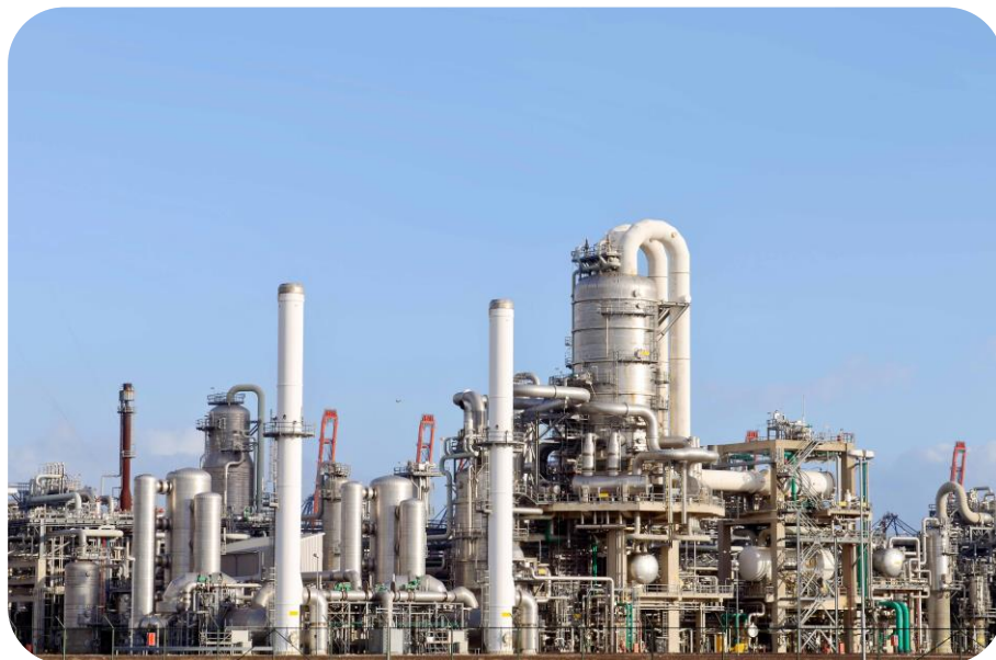
Remote Security Monitoring